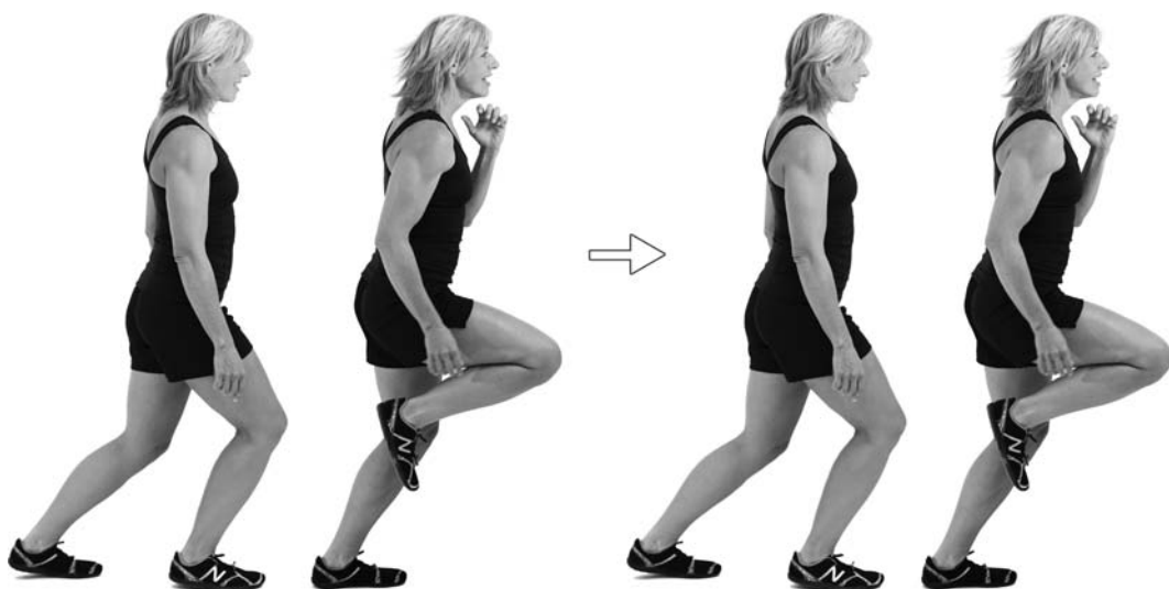
Wykrok z przejściem do przodu

8. Zmień nogę podpierającą i powtórz ćwiczenie.